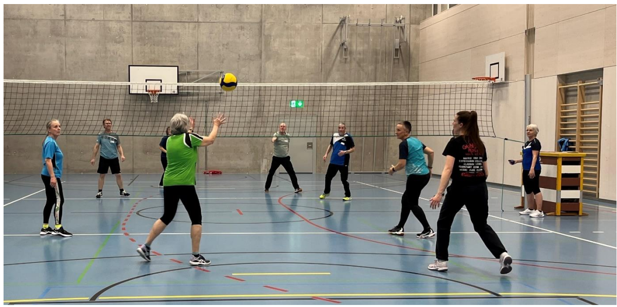
Impressionen Kreiskurs Hindelbank 2025