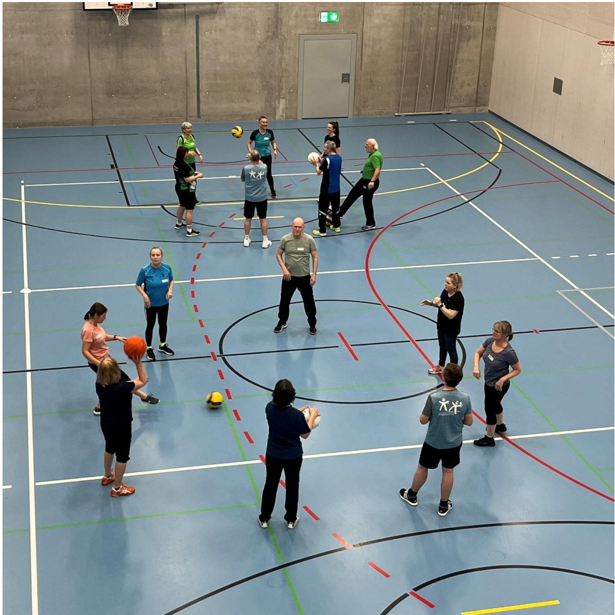
Impressionen Kreiskurs Hindelbank 2025